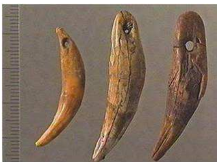
Agulles fetes de fusta

L'agulla es talla en un tros de fusta o d'os amb pedres punxegudes com el sílex. Un extrem ha de tenir la punta esmolada i en l'altre es fa un forat.