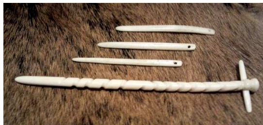
Agulles fetes amb os d'animal

Els vestits estan ben tallats. S'inventen noves formes i apareix la caputxa .