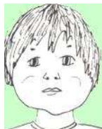
INFLAR LES GALTES D'AIRE