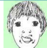
LLEPAR ELS LLABIS, FENT VOLTES AMB LA LLENGUA