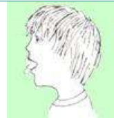
TOCAR EL LLABI SUPERIOR I EL LLABI INFERIOR ALTERNATIVAMENT