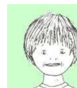
SOMRIURE AMB LA BOCA TANCADA