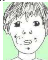
FER VOLTES AMB LA LLENGUA ENTRE ELS LLABIS I LES DENTS