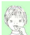
TREURE LA LLENGUA LA MÀXIM