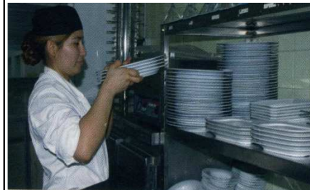
Ajudant de cuina. Diàleg