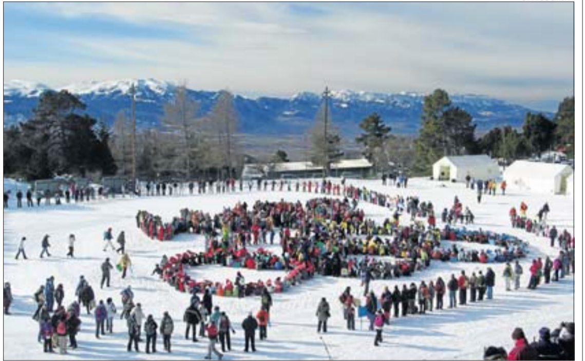
Una de les activitats realitzades durant la cerimònia inaugural dels Jocs Olímpics dels Petits Muntanyencs.

L'activitat continua avui a La Cabanasse, amb la pràctica de jocs i proves per a les quals s'utilitzen raquetes; mentre que dijous, a Sant Pere dels Forcats, es dedicarà una jornada a la seguretat