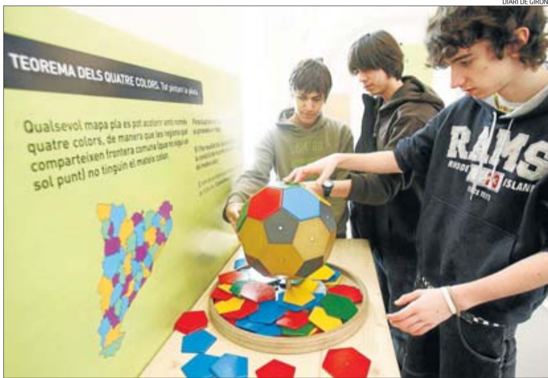
Uns nois accionen un dels materials exposats a la mostra sobre les matemàtiques, a la Casa de Cultura.

Els mòduls s'emmarquen en algun dels tretze blocs genèrics en els quals s'organitza el projecte: trencaclosques, corbes, efectes òptics, mosaics, estadística i atzar, miralls, fraccions, Pitàgores, estratègia, perímetre, àrea i volum, poli-