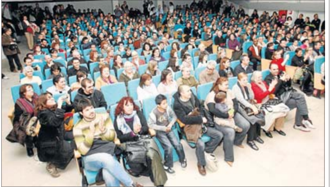
A l'esquerra, unes alumnes de l'escola Annexa durant la seva actuació al festival solidari i, a la dreta, la platea de butaques del teatre de l'IES Vicens Vives, on es va fer l'acte.