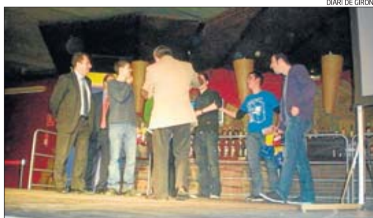
L'equip de l'institut gironí rebent el premi, en una discoteca a Mataró.

L'entrega de premis d'El Joc de la Borsa corresponent a 2009 es va fer el 28 de gener a Mataró. Cada integrant de l'equip va guanyar una càmera fotogràfica, mentre que l'institut ha obtingut material informàtic i altres obsequis.