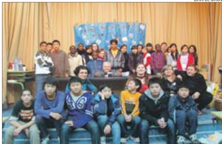
L'alumnat de les aules d'acollida que van participar en la trobada.

Els responsables de les aules d'acollida van destacar que la trobada va permetre crear un espai adequat perquè els alumnes nous poguessin compartir un mateix projecte, es coneguessin i comprovessin que la seva situació lingüística és semblant a la d'altres nois i noies que estudien a la res-