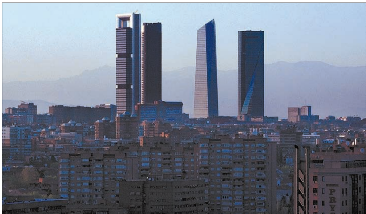
▶▶ Els gratacels de l'antiga ciutat esportiva del Reial Madrid, al districte de Chamartín, fa uns mesos.