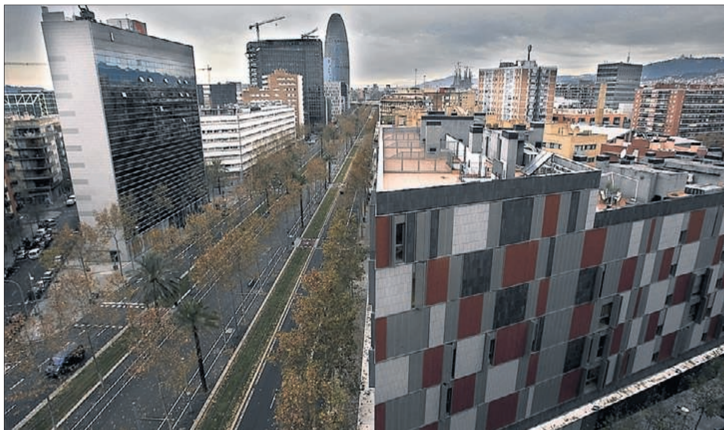
▶▶ L'avinguda Diagonal, en el seu tram del districte de Sant Martí, amb la torre Agbar de fons, fa una setmana.

Barcelona segueix amb la mateixa extensió, més o menys, que el 1921, quan s'hi va annexionar Sarrià. Les poblacions del seu voltant han anat creixent i han escam-