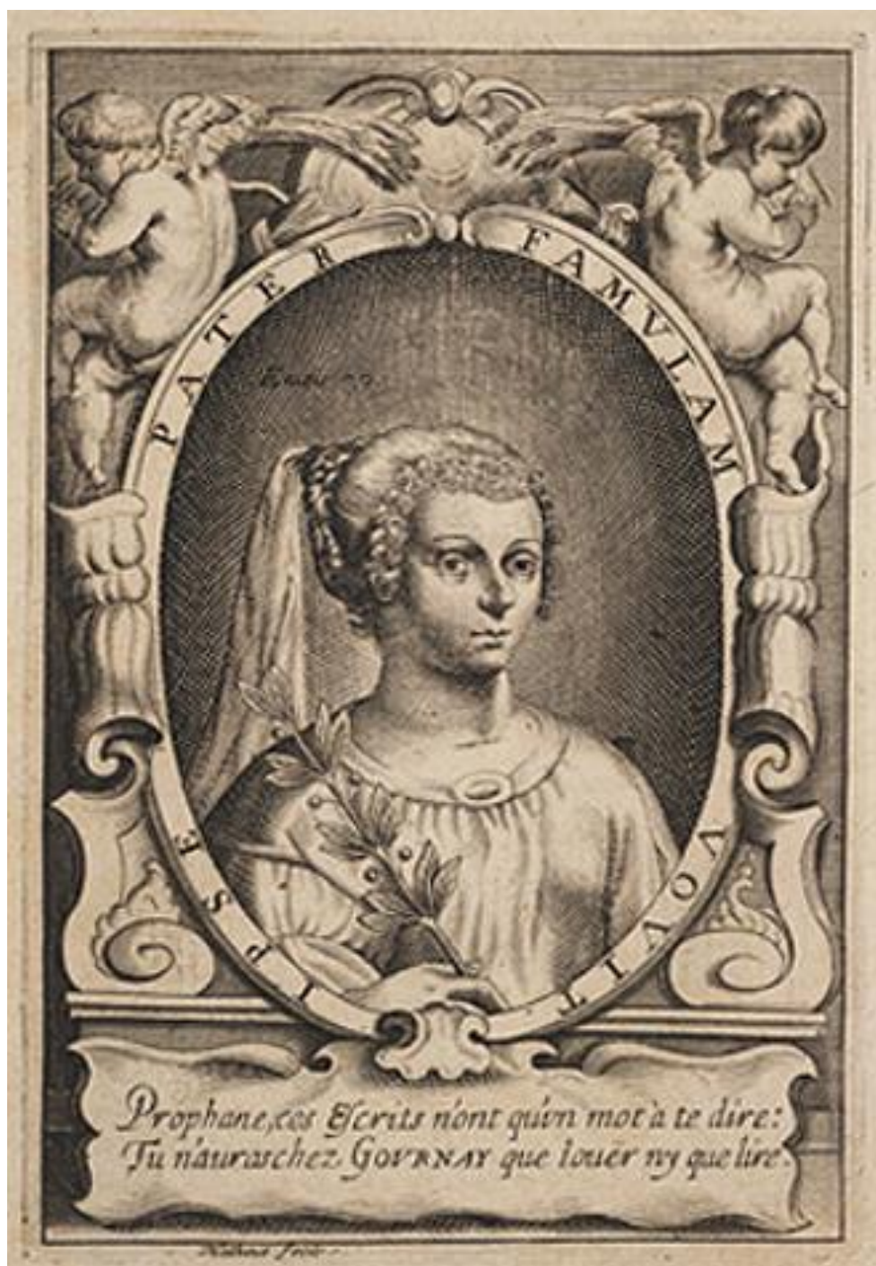
Marie de Gounay. Gravat de Matheus, Biblioteca Nacional, París