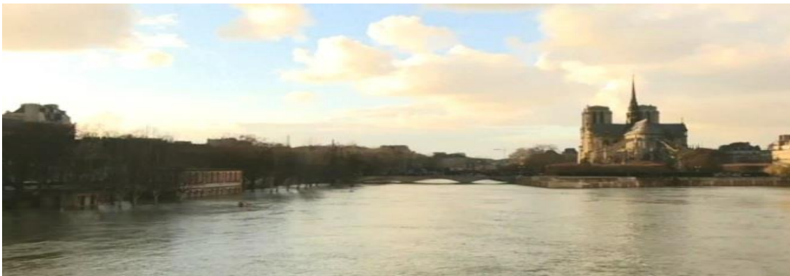
Riu Sena a París, ciutat on va néixer i va morir Marie de Gornay

A l'opuscle Greuges de dames (1626) criticà els homes que menyspreaven les obres de les dones sense haver-les llegides, argumentant que la seva queixa era argumentada, atès que la subordinació de les dones no era ni natural ni innata, sinó el resultat dels prejudicis dels homes i, per tant, susceptible de canviar. Defensà les capacitats de les dones reivindicant-ne el reconeixement de l'autoritat cultural i la igualtat de disposicions per mantenir amb els homes qualsevol debat. El text comença comparant la discriminació que patien les dones respecte dels homes: manca de llibertat, impossibilitat d'exercir el poder i privació a l'accés al saber. Per Marie de Gournay, el proteccionisme i la galanteria eren convencions tradicionals que protegien i elevaven encara més el poder masculí, a la vegada que impedièn el desenvolupament de les dones i la igualtat entre tots dos sexes.