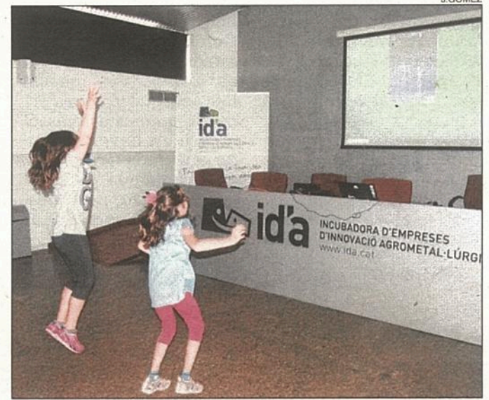
Els estudiants van treballar la mobilitat sensorial.