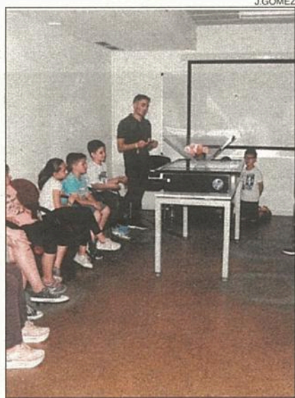
El taller dedicat a les holografies.