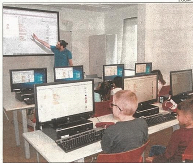
Els participants van aprendre a programar tot jugant.