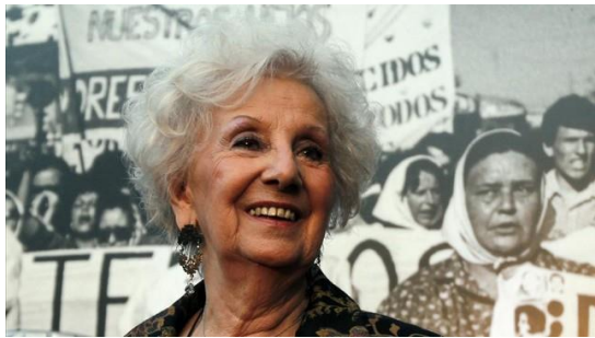
ABEL GILBERT / Buenos Aires EL PERIÓDICO, MARTES, 25 DE MARZO DEL 2014

Seis de cada 10 argentinos creen que la asonada no tuvo justificación, pero un 20% aún la defiende