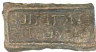
Signaculum de Vallmora (segle II dC).

S'han localitzat i documentat un total de tres sales de premsat o torculars , que presenten instal·lades dues premses d'alçaprem o biga cadascuna, donant un total de sis premses documentades en el jaciment. Tot i això, atenent els aspectes cronològics i temporals abans esmentats, el seu funcionament simultani sembla reduir-se a dos àmbits de premsat i, per tant, a quatre premses treballant al mateix temps. Una d'aquestes grans premses conserva la pedra original ( forum o lapis pedicinus ) amb els corresponents forats rectangulars per encaixar-hi els muntants superiors ( arbores ).