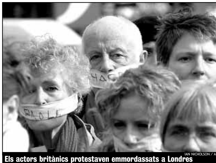
Els actors britànics protestaven emmordassats a Londres

La comunitat teatral internacional també crida 'Aturem la guerra'. Perquè la seva veu s'escolti amb força, ahir es feien més de mil lectures de la comèdia grega 'Lisístrata' en una seixantena de països, entre els quals hi havia Catalunya.