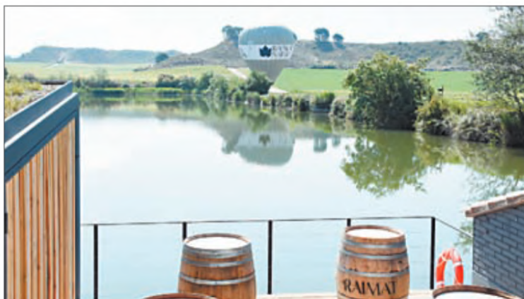
La zona disposa de tres circuits senyalitzats i al centre d'interpretació s'atén els visitants i es pot gaudir dels vins de Raimat i de tapes amb producte Km 0