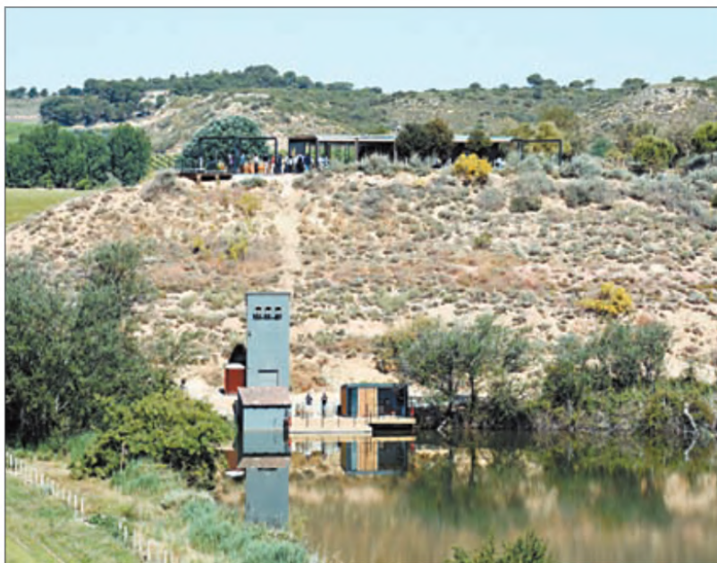
Els observatoris permeten contemplar els centenars d'aus que acull Raimat Natura

A l'estiu, Raimat es converteix en zona de cria i reproducció de