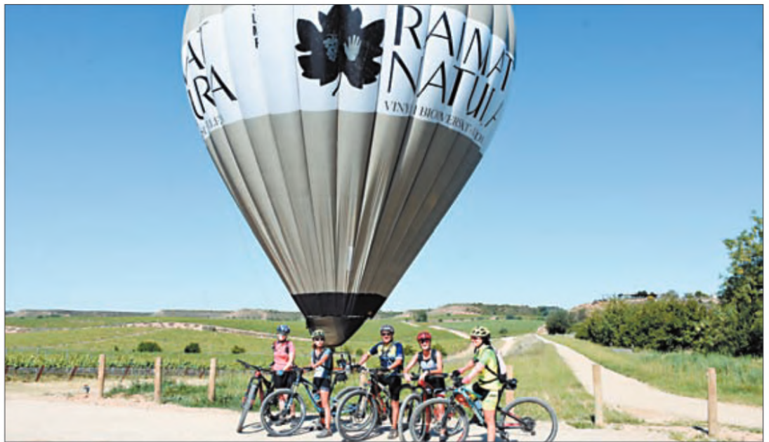
L'espai natural, que té una superfície de més de 700 hectàrees, es pot visitar a peu, amb bicicleta i, fins i tot, en globus aerostàtic

La proposta turística també consta d'un centre d'activitats, gestionat per empreses col·laboradores, en què es poden fer rutes guiades, marxa nòrdica (hi ha la possibilitat de llogar els pals), activitats d'orientació i passejos en globus per damunt de la finca. A més, s'han senyalitzat tres circuits per fer-los a peu, amb