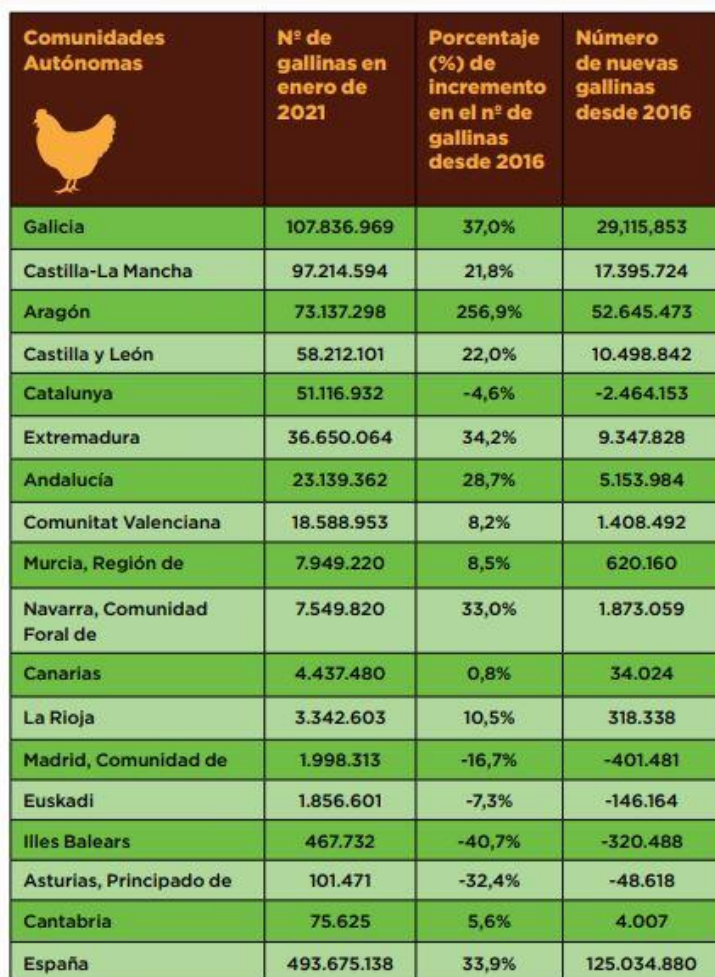
TABLA 4. NÚMERO DE GALLINAS, TANTO PARA HUEVOS COMO PARA CARNE, PRODUCIDAS EN ENERO DE 2021, EN CADA COMUNIDAD AUTÓNOMA Y EL TOTAL ESTATAL, ORDENADO DE MAYOR A MENOR, Y EL PORCENTAJE (%) DE INCREMENTO DEL NÚMERO DE GALLINAS DESDE 2016 HASTA 2021.