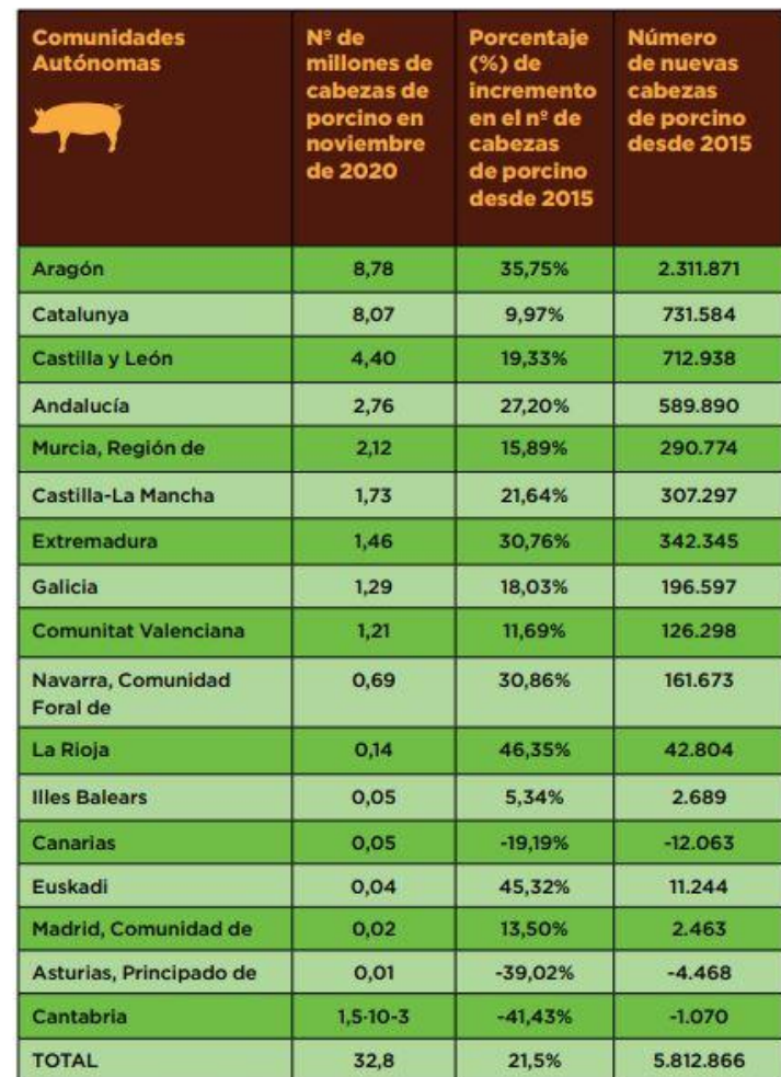
TABLA 2. NÚMERO DE MILLONES DE CABEZAS DE PORCINO EN NOVIEMBRE DE 2020, EN CADA COMUNIDAD AUTÓNOMA Y EL TOTAL ESTATAL, ORDENADO DE MAYOR A MENOR, Y EL PORCENTAJE (%) DE INCREMENTO DEL NÚMERO DE CABEZAS DE PORCINO DESDE 2015 HASTA 2020.