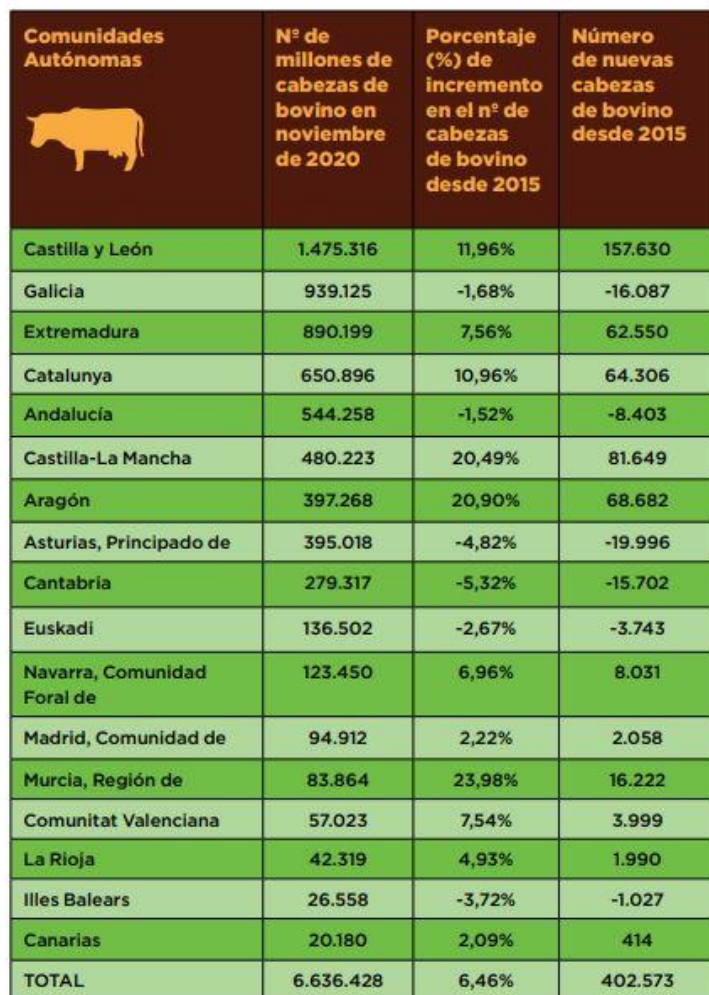
TABLA 3. NÚMERO DE CABEZAS DE GANADO VACUNO EN NOVIEMBRE DE 2020, EN CADA COMUNIDAD AUTÓNOMA Y EL TOTAL ESTATAL, ORDENADO DE MAYOR A MENOR, Y EL PORCENTAJE (%) DE INCREMENTO DEL NÚMERO DE CABEZAS DE VACUNO DESDE 2015 HASTA 2020.