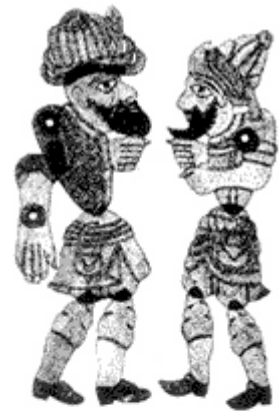
Figuras típicas turcas

Erase que se era, una sombra. Como dice Carlos Angoloti, la sombra está a caballo entre lo real y lo ficticio, entre el ser y el no ser, lo mágico y lo religioso. Las sombras suponen la imagen más palpable del mundo de lo abstracto, del mundo de las ideas, de aquello que trasciende lo que nuestros sentidos perciben. Es precisamente esta característica de las sombras, a medio camino entre la luz y las tinieblas, participando de la esencia de las cosas sin llegar a ser ellas mismas, la que las ha hecho vehículo de comunicación de mitos, magias e historias a lo largo de los tiempos.