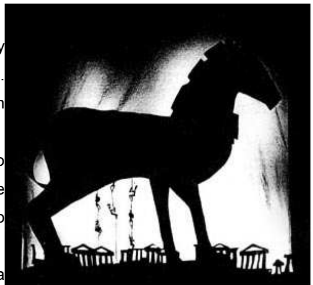
Representación del Caballo de Troya