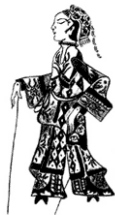
Personaje clásico chino