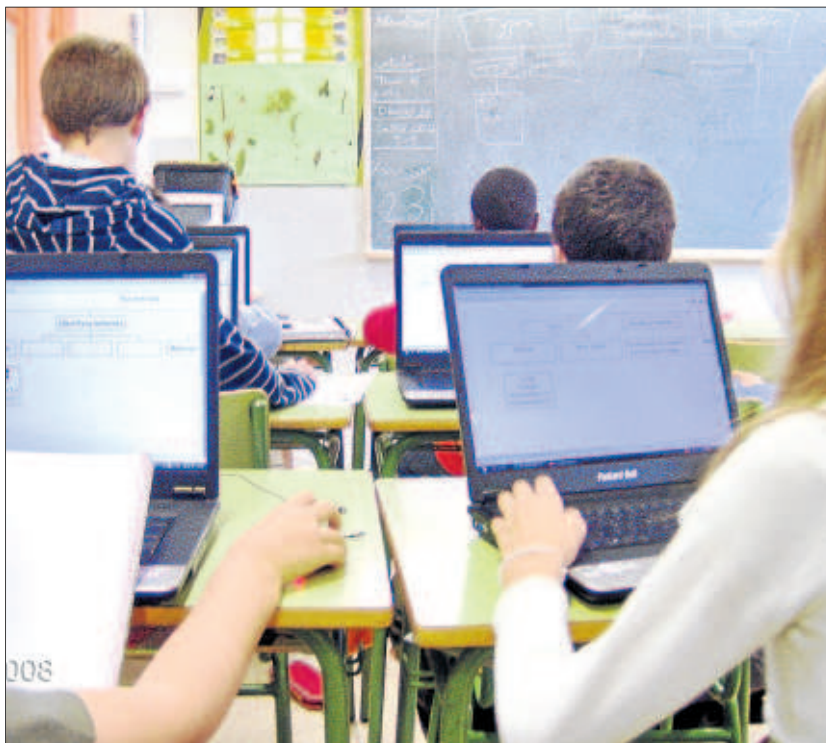
Els alumnes de 5è del Pràctiques I treballen amb els portàtils durant una sessió de science.