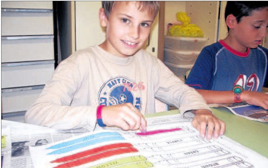
Els alumnes de tercer i quart curs del CEIP Pràctiques I fan plàstica en anglès.

L'Englart és el mètode del CEIP Guillem Isarn per a l'aprenentatge de l'idioma estranger, en aquest cas anglès, a través d'activitats.