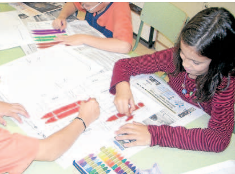
ixen per treballar la plàstica en anglès a cicle mitjà, al CEIP Pràctiques I.

L'ús de la llengua estrangera com a vehicular d'una matèria permet aprendre l'idioma sense que els nens i nenes siguin conscients que l'estan estudiant