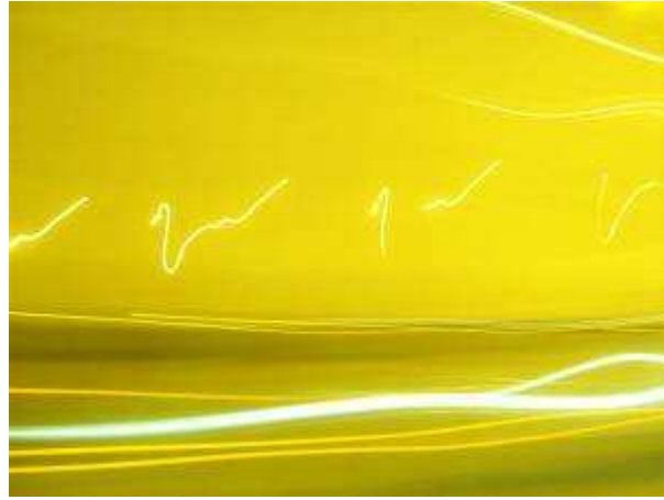
Traces de llum que es barregen dins del túnel enfosquit.