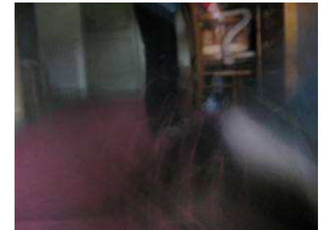
El blau dels pantalons es barreja amb el verd i forma un personatge pervers i misteriós.