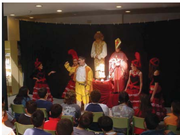
Representació teatral realitzada dintre de la programació d'actes de la diada de Sant Jordi