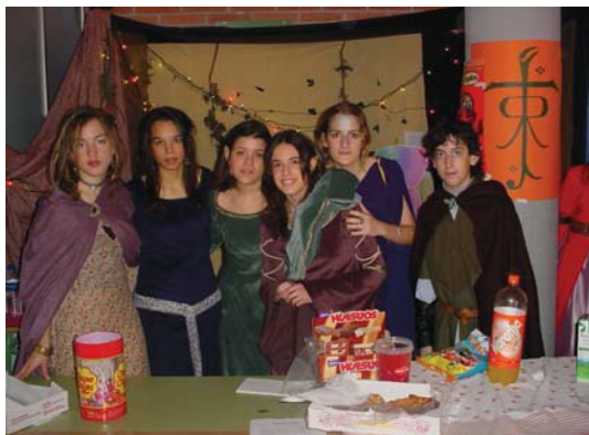
Bar organitzat pel consell de delegats amb motiu de la celebració del carnaval 2001