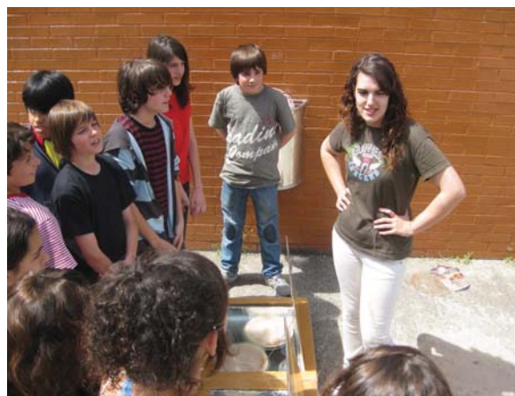
Una alumna de 4t d'ESO explica el funcionament d'un forn solar a un grup d'alumnes de 1r d'ESO (III Jornades d'energies alternatives i medi ambient)