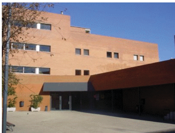
Edifici de l'IES Badalona VII

Portal web: http://phobos.xtec.cat/iesb7