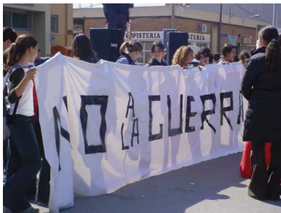
Membres del consell de delegats participant en una manifestació d'estudiants contra la Guerra d'Iraq.