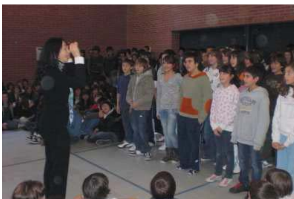
Concert de Nadal 2008