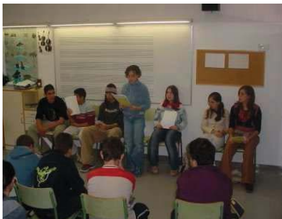
Reunió del consell de delegats

El consell de delegats i delegades és l'òrgan que facilita la comunicació entre els alumnes dels diferents cursos i nivells i els òrgans de govern de l'institut i canalitza la participació de l'alumnat en la vida del centre.