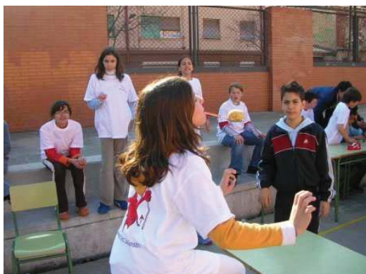
Gimcana realitzada en el marc de les activitats d'acollida de l'alumnat que s'incorpora a l'institut a 1r d'ESO