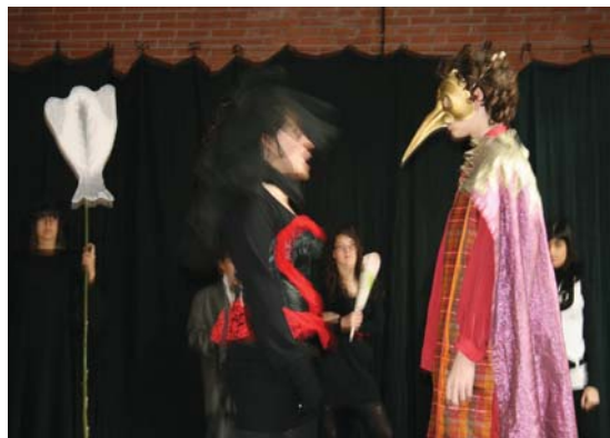
Carnaval 2009: batalla entre Carnaval i la Quaresma