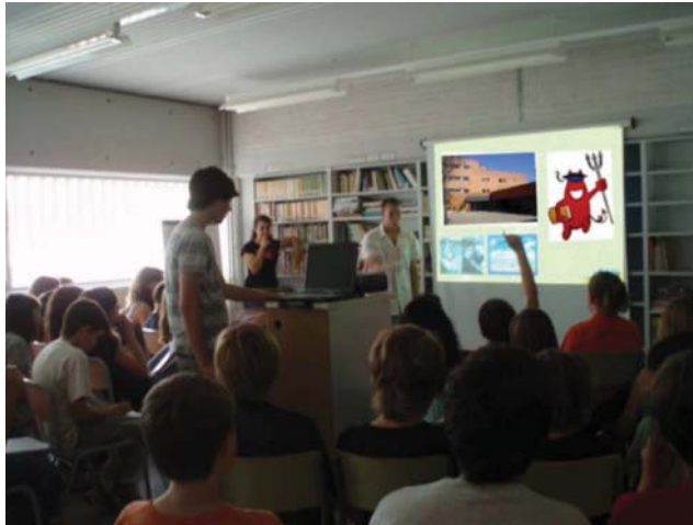
Alumnes d'ESO de l'institut explicant el funcionament de l'IES Badalona VII a l'alumnat de 6è de primària d'una de les nostres escoles adscrites.