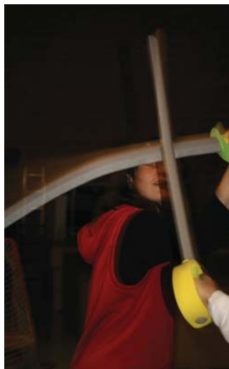
TALLERdTEATRE, pràctiques d'esgrima teatral