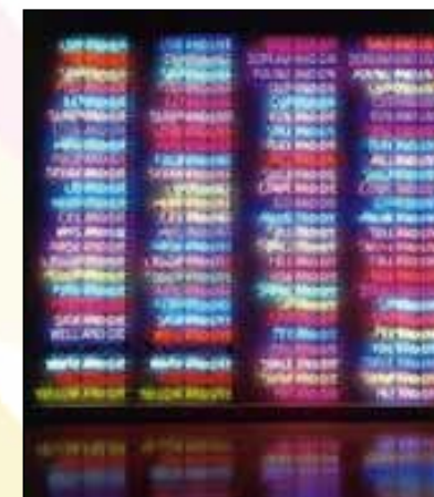
Bruce Nauman, Dead and live 1984.