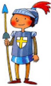
CAVALLER SANT JORDI