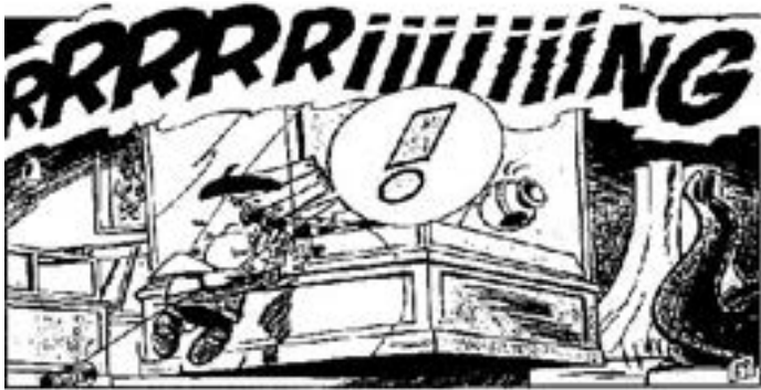
© Peyo. Les aventures de Benet Tallaferro. (versió d'Albert Jané).