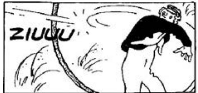
© Madorell. Les aventures encara més extraordinàries d'en Massagan. © Franquin. Sergi Grapes.