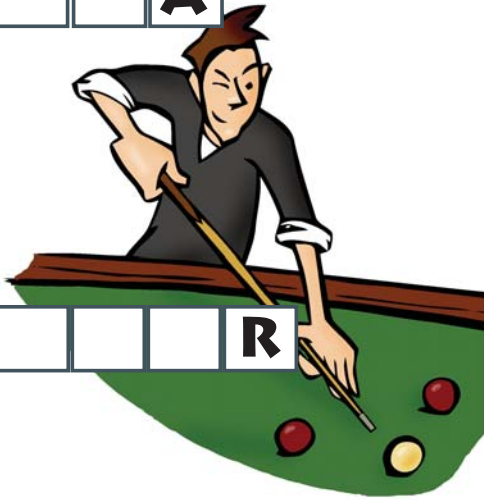
Amb el tac has de ficar dins dels forats les boles de colors