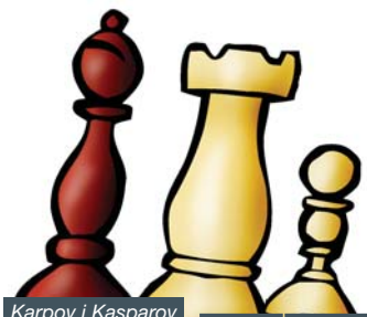
Karpov i Kasparov van popularitzar-lo durant molt de temps