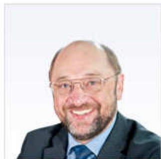
Parlamento Europeo: la voz del pueblo Martin Schulz, Presidente del Parlamento Europeo