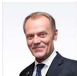
Consejo Europeo y Consejo: la voz de los Estados miembros Donald Tusk, Presidente del Consejo Europeo