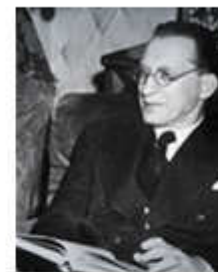
Alcide De Gasperi