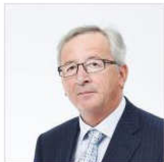
Comisión Europea: el interés común Jean-Claude Juncker, Presidente de la Comisión Europea