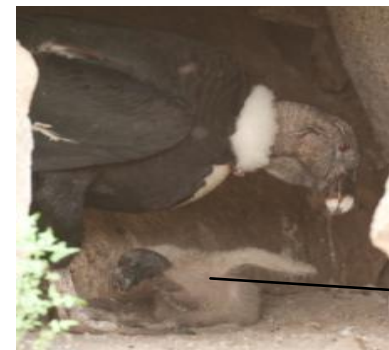
La seva cria

La femella posa generalment un sol ou color blanc, d'uns 10 cm de llarg. La incubació dura al voltant de 55 dies, el mascle i la femella fan torns per donar calor a l'ou.