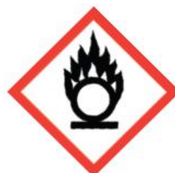
GH503 Flame over Circle