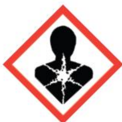
GH508 Health Hazard