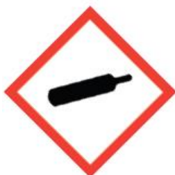
GH504 Gas Cylinder