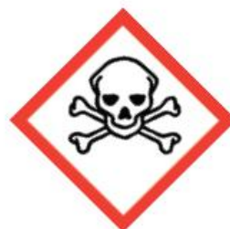
GH505 Skull and Crossbones