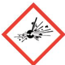
GH501 Exploding Bomb

Els nous pictogrames ( 9 símbols en forma de rombe amb fons blanc i la vora vermella ) substitueixen els anteriors (7 símbols en forma de quadrat de color taronja).