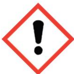
GH507 Exclamation Mark