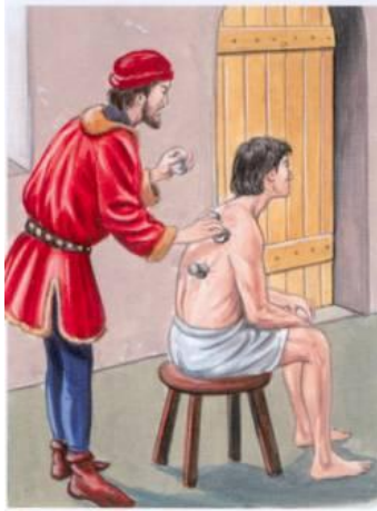
Un metge examinant a un pacient