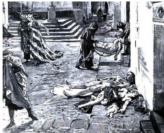
La Peste Negra en Italia en 1348, según una ilustración de Marcello