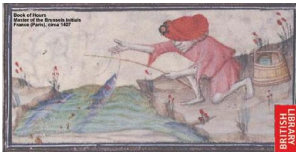
Un habitant pescant

Un dels mètodes més utilitzats per conservar la carn i el peix era el de salar els aliments. Amb una bóta de fusta, la carn podia aguantar mesos. La qualitat dels plats depenia del lloc que ocupava la persona que se l'havia de menjar.