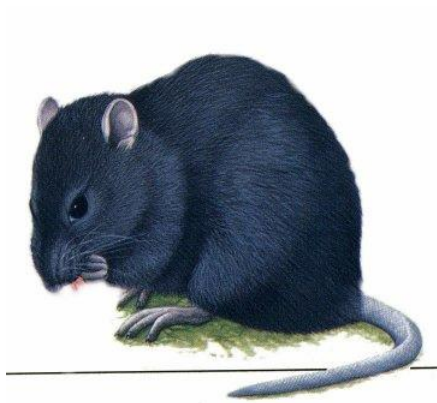
Una rata que portava la "Pesta"