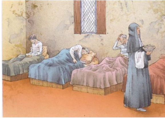
Malalts en un hospital