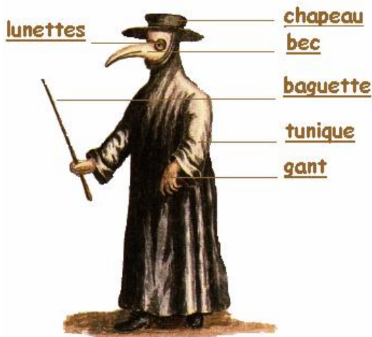
la pesta a Itàlia