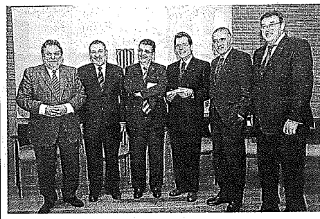
Homenatge als consellers d'Agricultura. El departament d'Agricultura va homenajar ahir els consellers d'Agricultura des de la restauració de la democràcia.