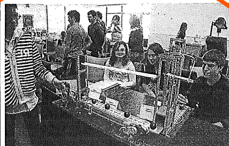
Tecnologia a l'institut. Uns 300 alumnes presenten des d'ahir i fins avui 77 projectes tecnològics al campus de Capponet de la UdL, per on passaran uns 800 estudiants. I.F.