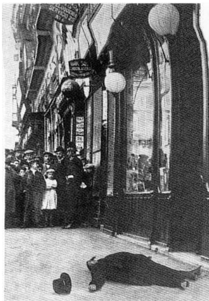
El público contempla el cadáver de Canalejas después del atentado de la Puerta del Sol.