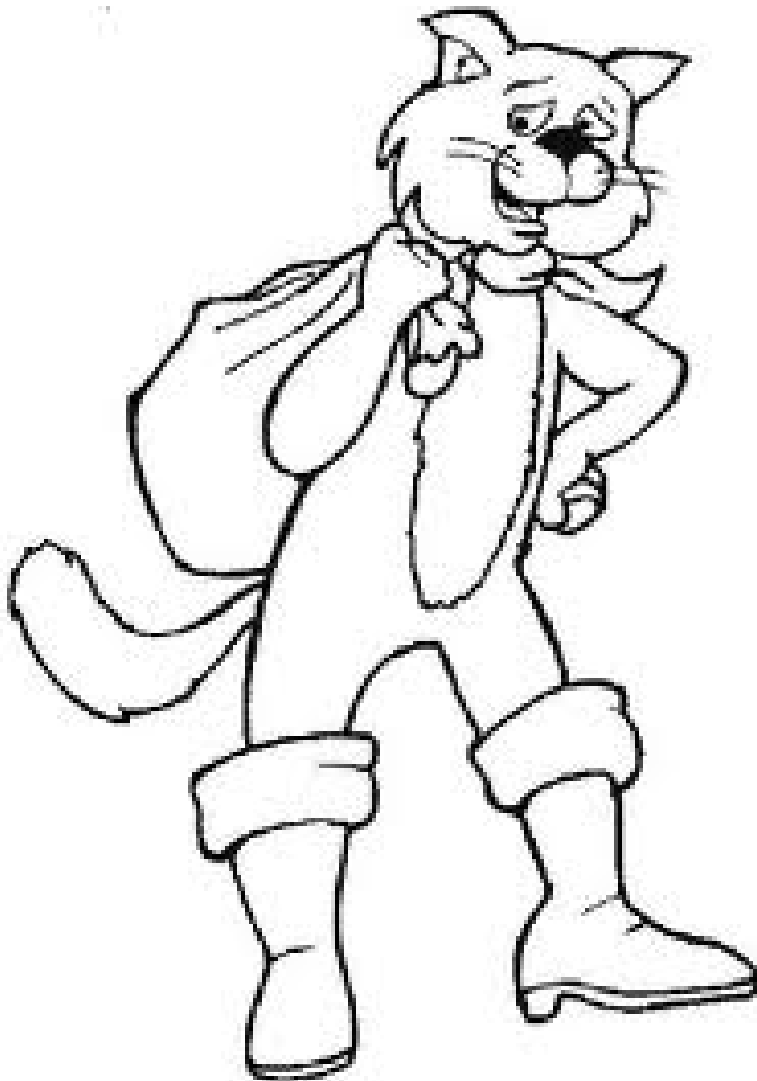
Els Gats amb botes.