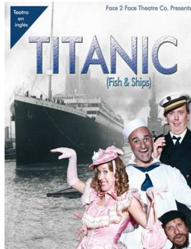
Teatro en inglés