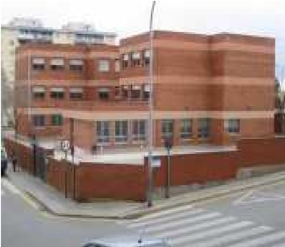
Colegio Josep María Ciurana