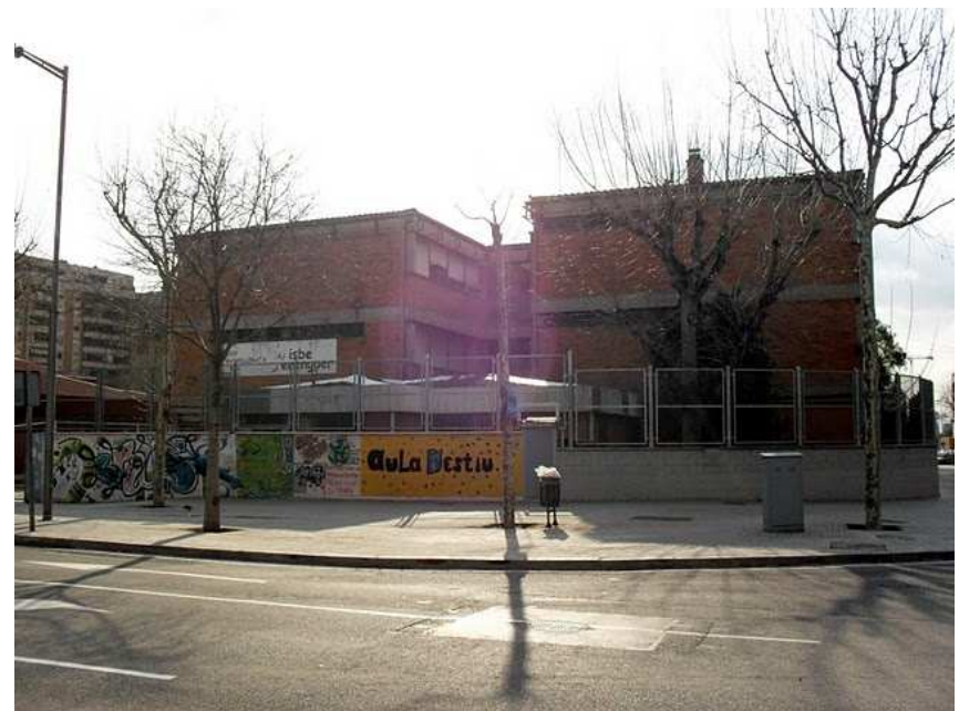
Instituto Bisbe Berenguer